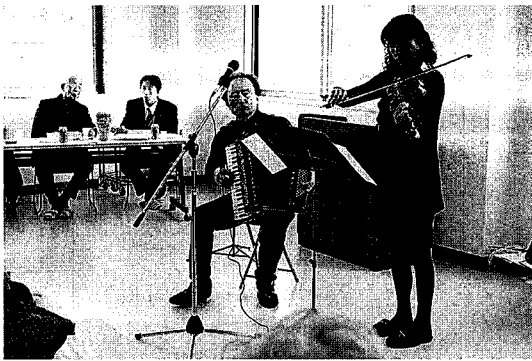
▲ ジャバラ・ヴィの名演奏