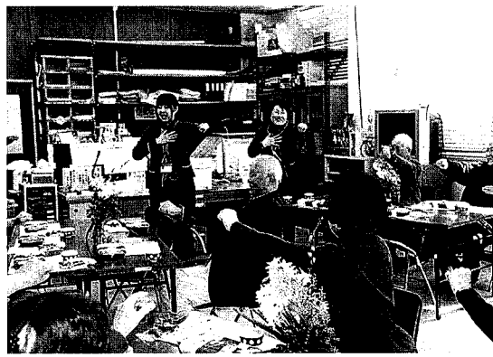
▲ ふれあいサロンの健康体操

終わりに「365日の紙飛行機」、「愛燦燦」、「青い山脈」を生伴奏してもらい、会場の皆で大合唱。めでたい新春の楽しいコンサートとなりました。