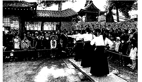
▲ 広島井口高校弓道部女子の追儺弓取神事

2月4日、大歳神社で第13回の節分祭（追儺弓取神事）が開催され、境内は善男善女で埋まりました。