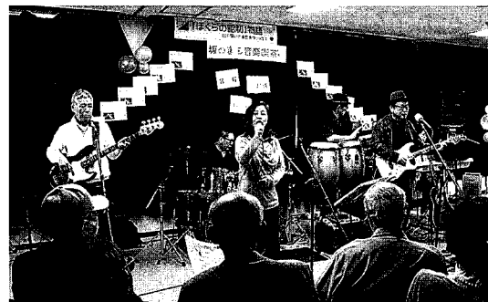
▲ ナンジャーズのみなさんの本格的な演奏

第3回目は、井口公民館で「まちの音楽喫茶」と題して、昭和に流行った懐かしい曲を演奏。1部ではナンジャーズの演奏で「ダンシングオールナイト」などの名曲を、2部では公民館利用者グループの方の演奏の披露があり、最高潮。